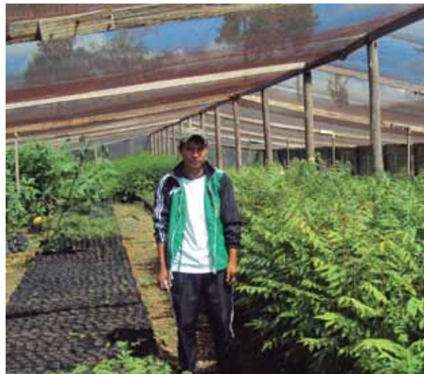
Foto 1: Vivero forestal.

Esta región es una de las cuatro en el departamento de Chuquisaca, se caracteriza por la migración de su población durante la última década a excepción del municipio de Villa Alcalá. Su Índice de Desarrollo Humano al 2005 (combinación entre elementos de salud, educación y generación de ingresos) en promedio no superaba el 0,5, por lo que coloca a esta zona entre las más pobres del país. Concentra una población indígena (básicamente Quechua) superior al 95%.