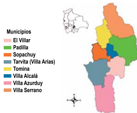
Figura 1: Mapa de la mancomunidad

La diversidad ecológica favorece el desarrollo de cultivos de ají, maní y frejol, entre los principales productos. En la parte pecuaria se