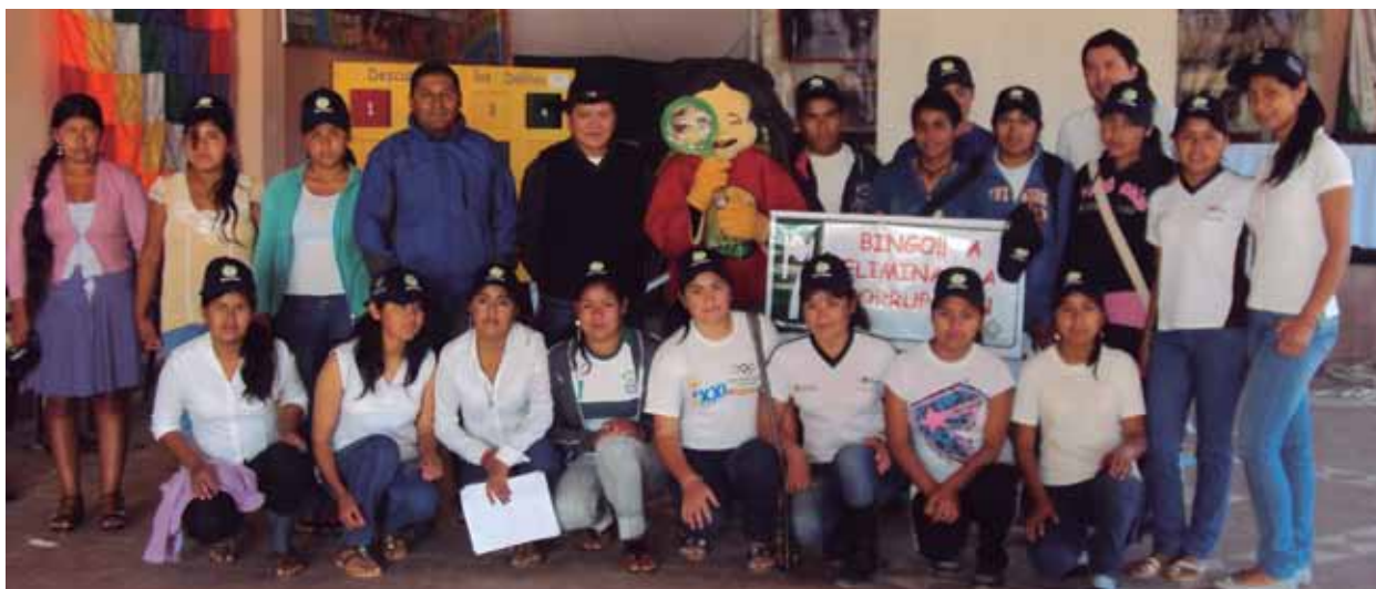
Foto 5: Participación de mujeres en la Feria de Transparencia Municipal.

El trabajo de género, es asumido como el trabajo integral y conjunto dentro de la familia,