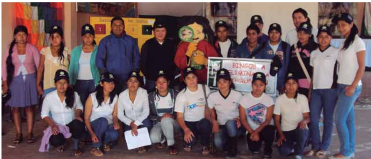
Foto 5: Participación de mujeres en la Feria de Transparencia Municipal.

El trabajo de género, es asumido como el trabajo integral y conjunto dentro de la familia,