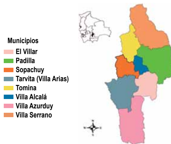
Figura 1: Mapa de la mancomunidad

La diversidad ecológica favorece el desarrollo de cultivos de ají, maní y frejol, entre los principales productos. En la parte pecuaria se