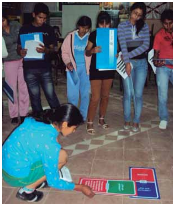
Foto 10: Jóvenes participando de actividades lúdicas durante la feria.

La Unidad de Transparencia a través del Plan Lupita es un órgano técnico operativo, con potestad para ejecutar acciones que sirvan para transparentar la gestión pública y la lucha contra la corrupción.