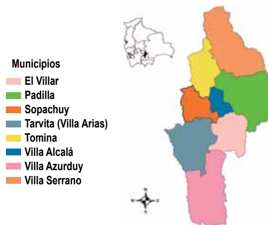
Figura 1: Mapa de la mancomunidad

La diversidad ecológica favorece el desarrollo de cultivos de ají, maní y frejol, entre los principales productos. En la parte pecuaria se