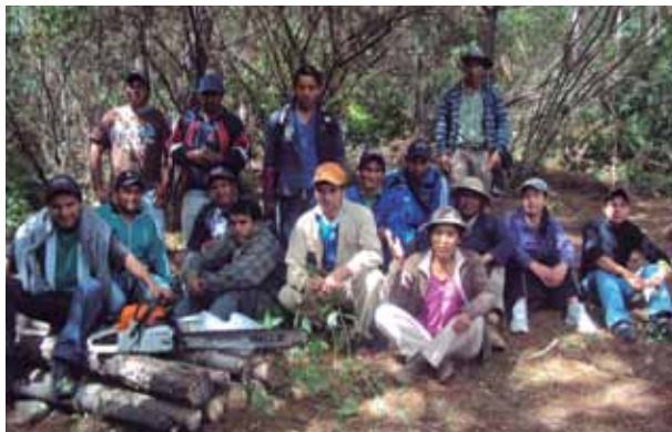
Foto 2: Intercambio de experiencia entre comunarios.

La gráfica precedente muestra el enfoque de trabajo en el aprovechamiento del agua en