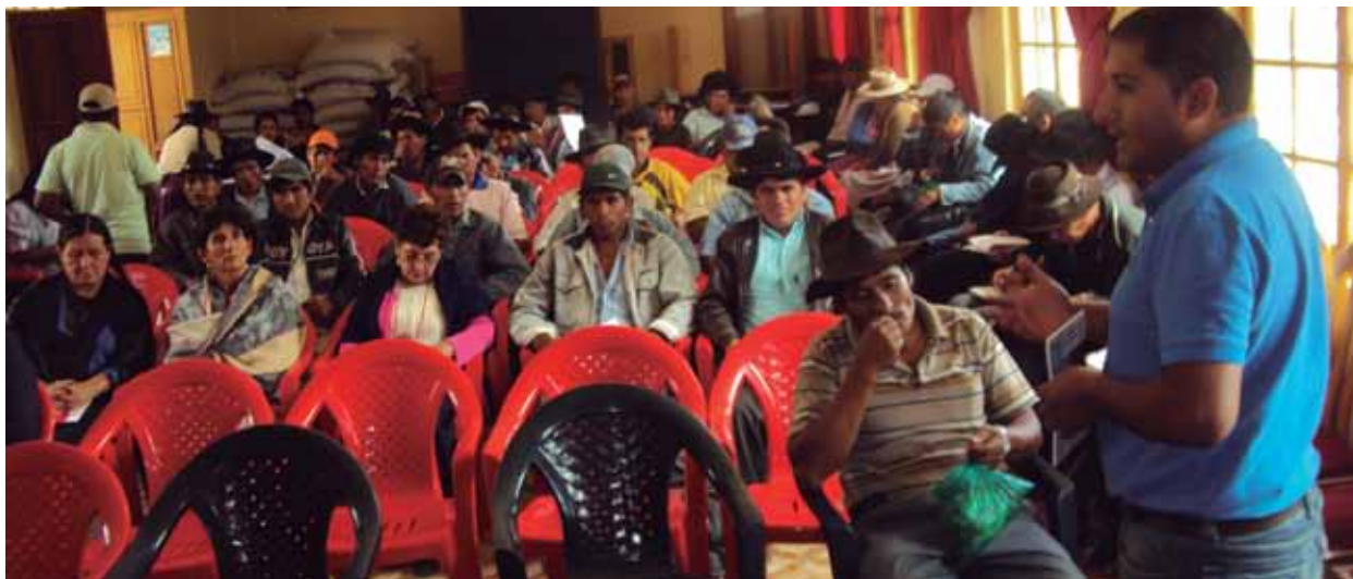
Foto 8: Actividades de socialización del Plan Lupita.