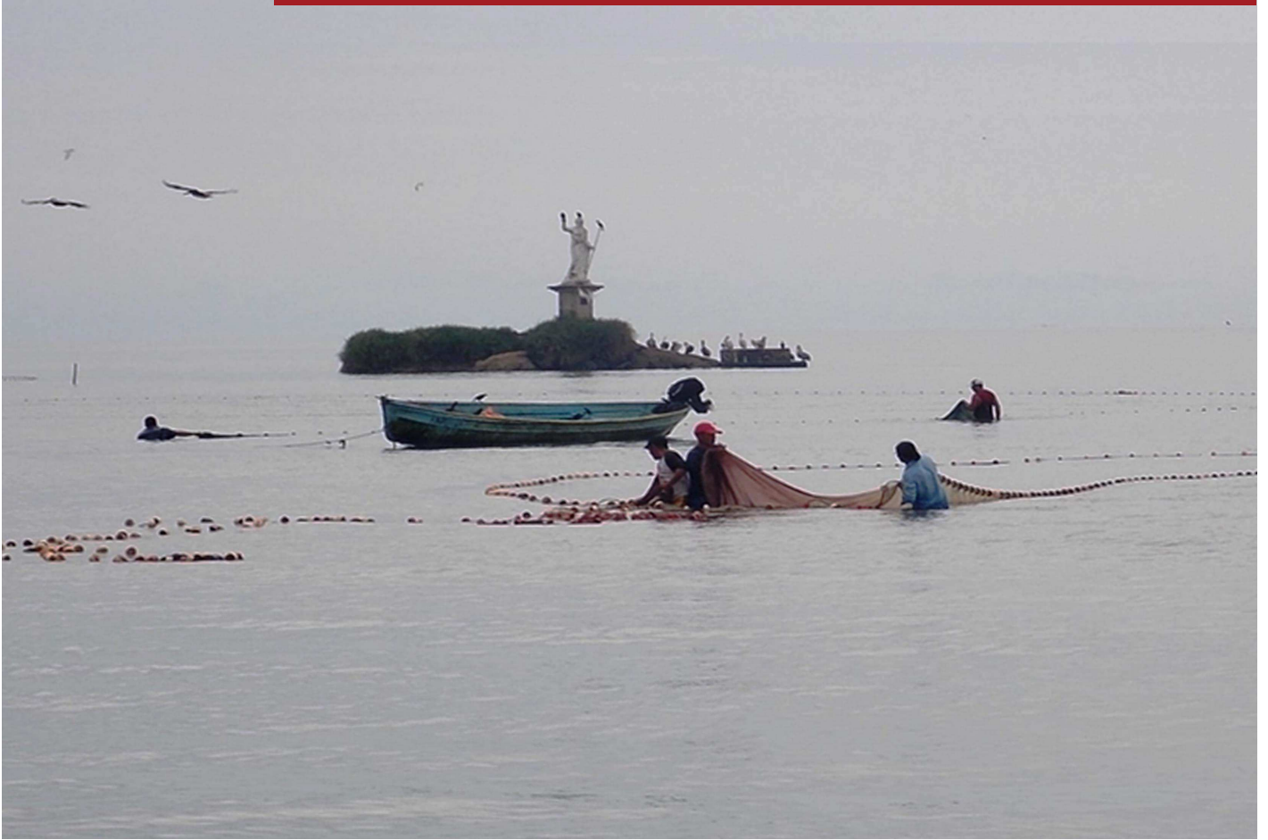
Faenas de pesca artesanal para las especies seleccionadas: Camarón, Manjúa y Peces de Escama en el Caribe de Guatemala.