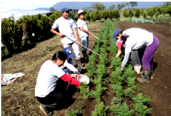
Alumnos y alumnas del proyecto Forja realizando prácticas agrícolas con diferentes hortalizas.