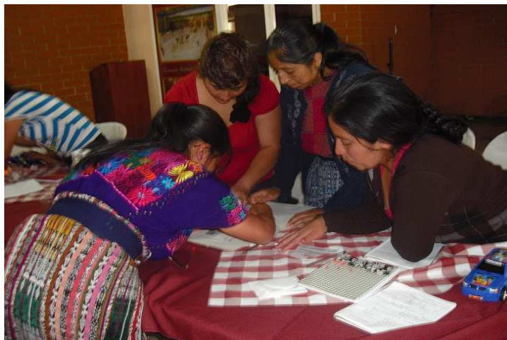
Taller de réplica sobre la participación equitativa en grupo organizado de mujeres de Esquipulas Palo Gordo, San Marcos.