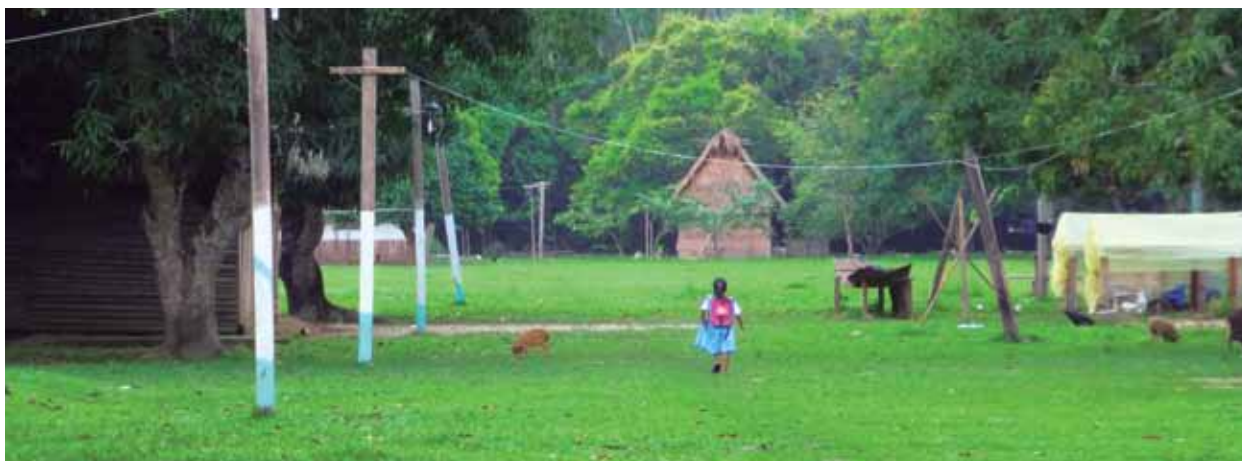
Foto 2: Vista panorámica de las comunidades ubicadas en la región.

Así, es preciso que más allá de una visión inmediatista de la autoridad local, es necesario que la mancomunidad, sea mucho más incisiva con el objetivo regional, demostrando que en el mediano plazo, temas como el cambio climático; el desarrollo económico extractivo, que no es sostenible a largo plazo; y que la incipiente cohesión regional; hacen del norte paceño tropical una región altamente vulnerable a la pobreza y la migración deben ser desarrollados. De hecho, en varios escenarios,