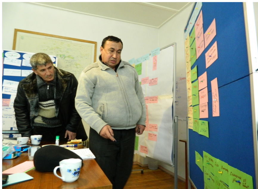
Во время семинара в Жалалабаде

Семинары по оценке потребностей 6 партнерских АВП проекта состоялись 8 февраля в Оше и 9 февраля в Жалалабаде. Директора АВП презентовали свои АВП, анализировали свои сильные и слабые стороны и определили пути решения проблем, которые сами смогут решить или где нужна поддержка от проекта. На основании оценки потребностей, были проведены семинары по планированию 28 февраля в Жалалабаде и 29 февраля в Оше. Проблемы АВП были пересмотрены и планы вмешательства были очерчены во время семинара.