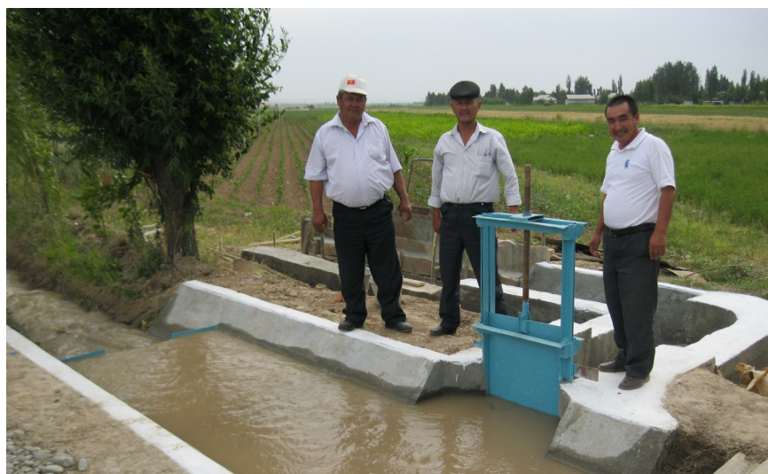
Водоизмерительное сооружение в АВП «Тойчубек Чек»

АВП «Тойчубек Чек» находится в Базар-Коргонском районе Жалал-бадаской области и имеет 689 членов. Она доставляет воду на более 1000 гектаров земли. Сотрудники АВП состоят из директора, одного бухгалтера и 5 мурабов. В 2011 году АВП активно сотрудничали с СКС Жалалабад в рамках проекта СЭП обучая фермеров и мурабов эффективному управлению воды, строительством водоизмерительных сооружений, иницируя метод Соколок распределения воды, организацией демонстрационных полей и полевых дней. 1