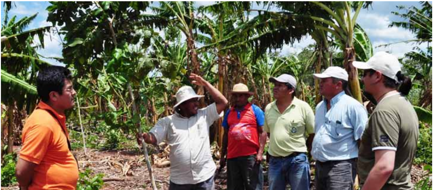
Productores chiquiteños junto a técnicos de la mancomunidad

El programa Gestión Territorial de Recursos Naturales (GESTOR) , forma parte del área de Gestión Sustentable de los Recursos Naturales de la Cooperación Suiza en Bolivia.