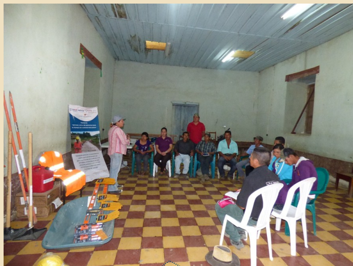
Entrega de Herramienta y equipo a Empresa Asociativa de Producción y Servicios de Mantenimiento Vial “Lenca” Municipio de San Sebastián, Lempira

Como parte del fortalecimiento de las microempresas, se desarrolla un programa de formación técnica y de negocios incluyendo la equidad de género, trabajo en equipo y liderazgo.