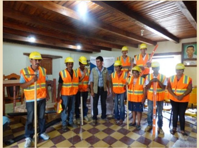
Miembros de la Empresa “Curicunque” en la entrega de Herramienta y equipo de trabajo. Belén, Lempira

Se realizó la entrega de equipo de protección y seguridad personal, así como también de herramientas de trabajo a directivos y socios de la Empresa Asociativa de Producción y Servicios de Mantenimiento Vial “CURICUNQUE” en el municipio de Belén y “LENCA” en el municipio de San Sebastián. El equipo consta de un vibro apisonador, apisonadores manuales, pico y piochas, azadones, rastrillos, palas, barras, niveles, carretas de mano, contenedor para herramientas, contenedor de combustible, cintas métricas, plomadas, conos, focos de mano, chalecos refractivos, guantes de cuero y cascos de protección, con una inversión total de L. 115,788.58.