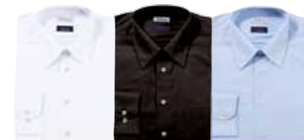
Farbcode 01 Farbcode 02 Farbcode 03

Bestellcode: WDA + Farbcode + Grösse Fr. 129.-